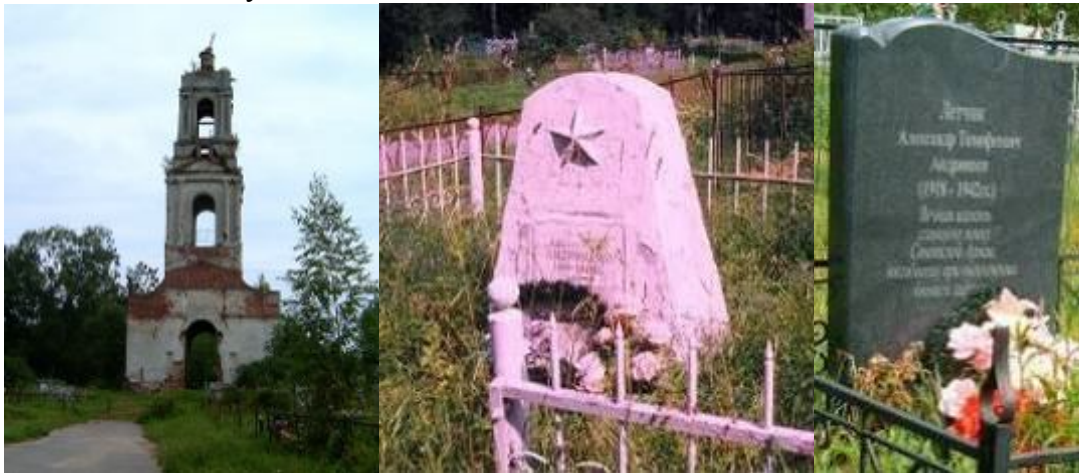
Успенская церковь в Заозерье