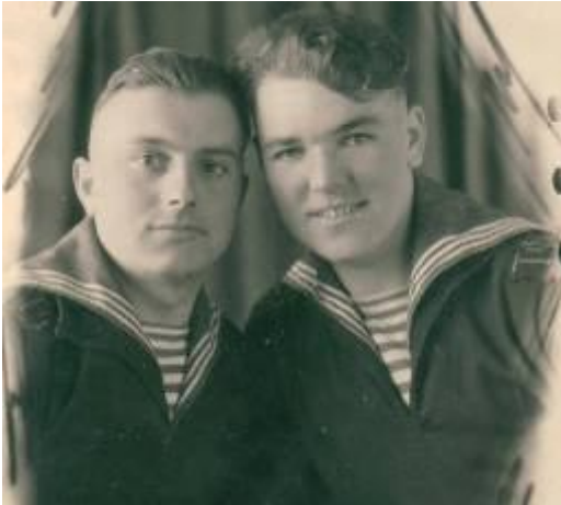
Фото 1945 г. Тихоокеанский флот

В конце июля 1945 г. нам объявили боевую готовность. Так началась подготовка к войне с Японией. А 9 августа наш дивизион дошёл до Кореи. После победы над Японией нас опять стали готовить в обратный путь – на Чёрное море, в город Одессу.