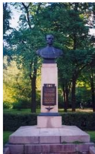
Памятник в С.-Петербурге