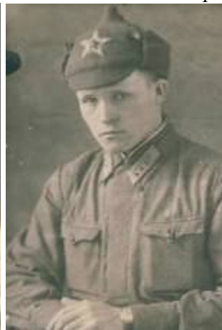
Ст. сержант ВДВ