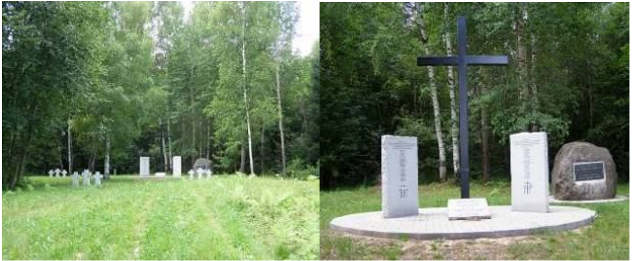
Мемориал на немецком кладбище под Угличем