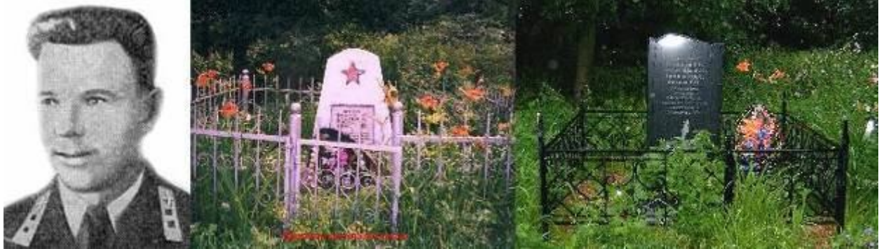
Фото 2004 и 2005 гг. Братская могила в с. Василёво

Несколько лет подряд на могилу приезжали родственники.