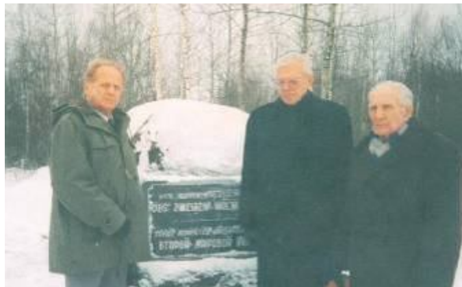
У памятника на немецком кладбище