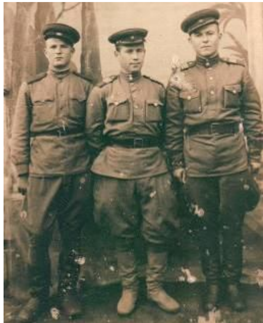
Фото 2.05.1946 г.