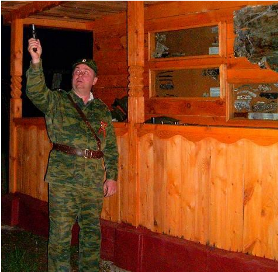
Праздничный салют 9-го мая у памятника защитникам неба Углича (Музей истории Углича)

На территории Угличского и Мышкинского районов имеется ряд могил лётчиков, погибших в годы Великой Отечественной войны. К сожалению не все имена удалось установить к настоящему времени.