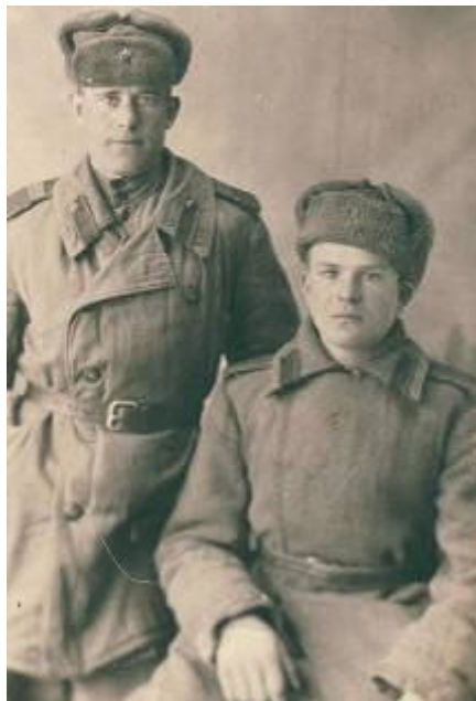
Фото 12.03.1944 г.

Дослуживал после войны в Благовещенске-на-Амуре, а потом, после демобилизации жил и работал шофёром в Угличском районе в деревне Варгуново в колхозе им. Матросова. Умер 14 марта 1990 года.