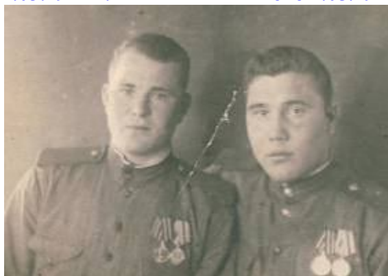
Фото 31.12.1946 г.