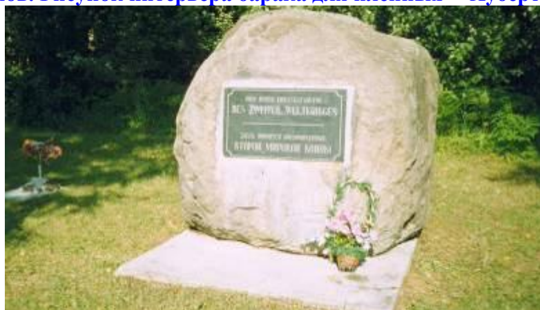
Камень на немецком кладбище

Швайгер Ганс (1915 г.р.), умер 1.01.1945 г. (квадрат №1, могила № 1);