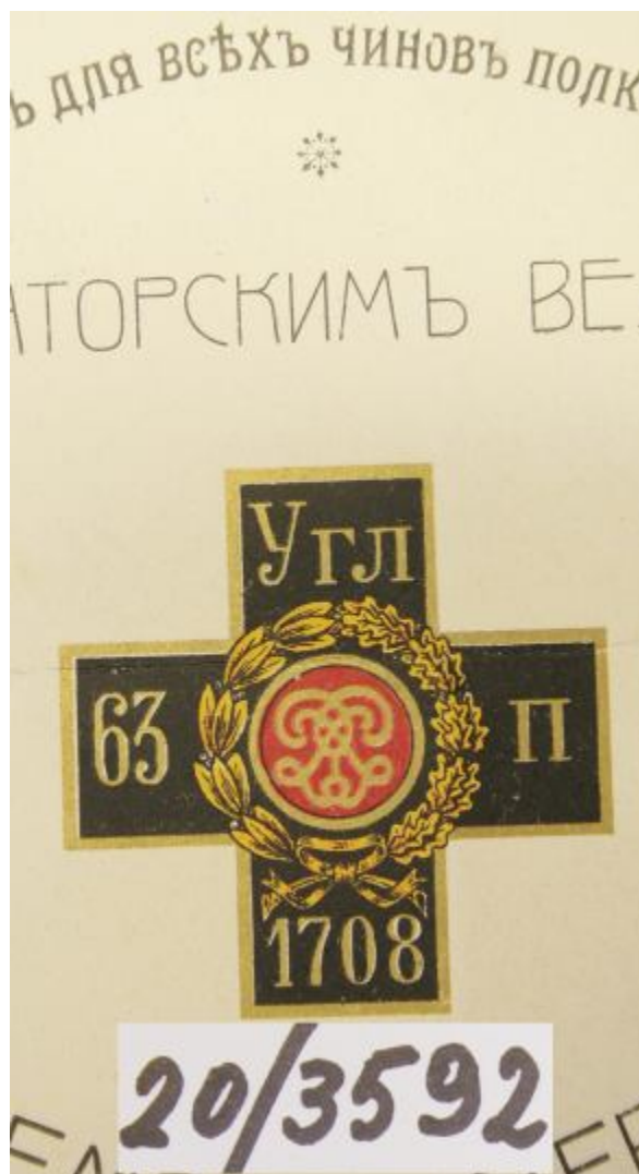
ЗНАК 63-го ПЕХОТНОГО УГЛИЦКОГО ПОЛКА