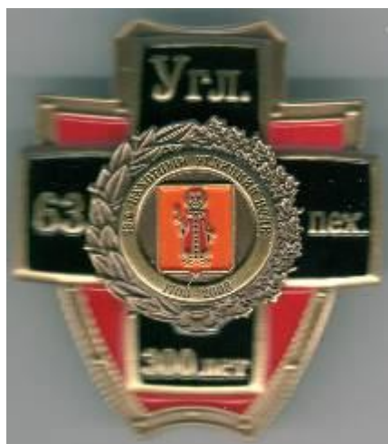
Знак «300-летие Угличского полка»