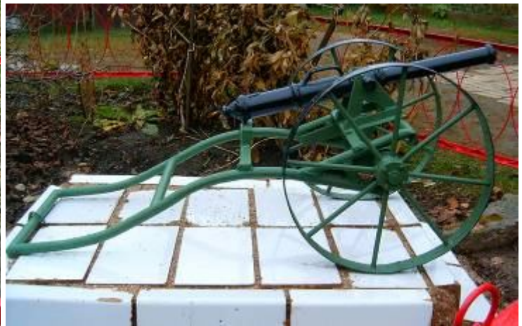
Монументы в музее «Угличские звоны»

17.10.2008 г. в Доме детского творчества состоялась итоговая конференция к 300-летию полка.