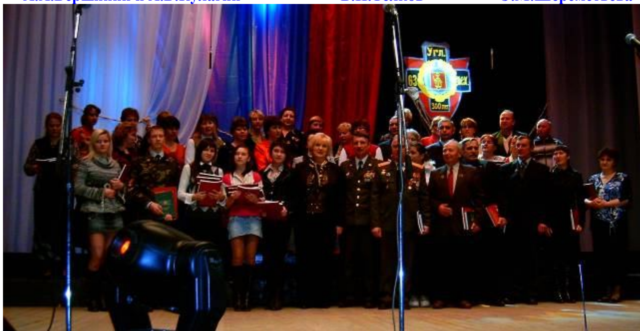
Угличане, награждённые Знаком «300-летие Угличского полка»