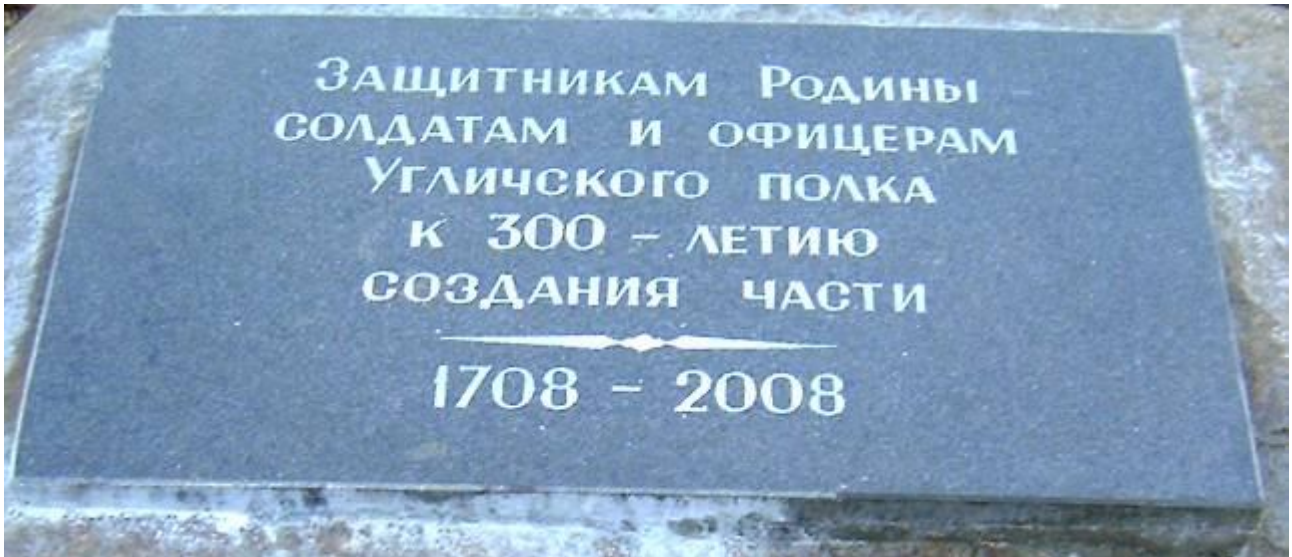
Мемориальный камень в честь 300-летия Угличского полка