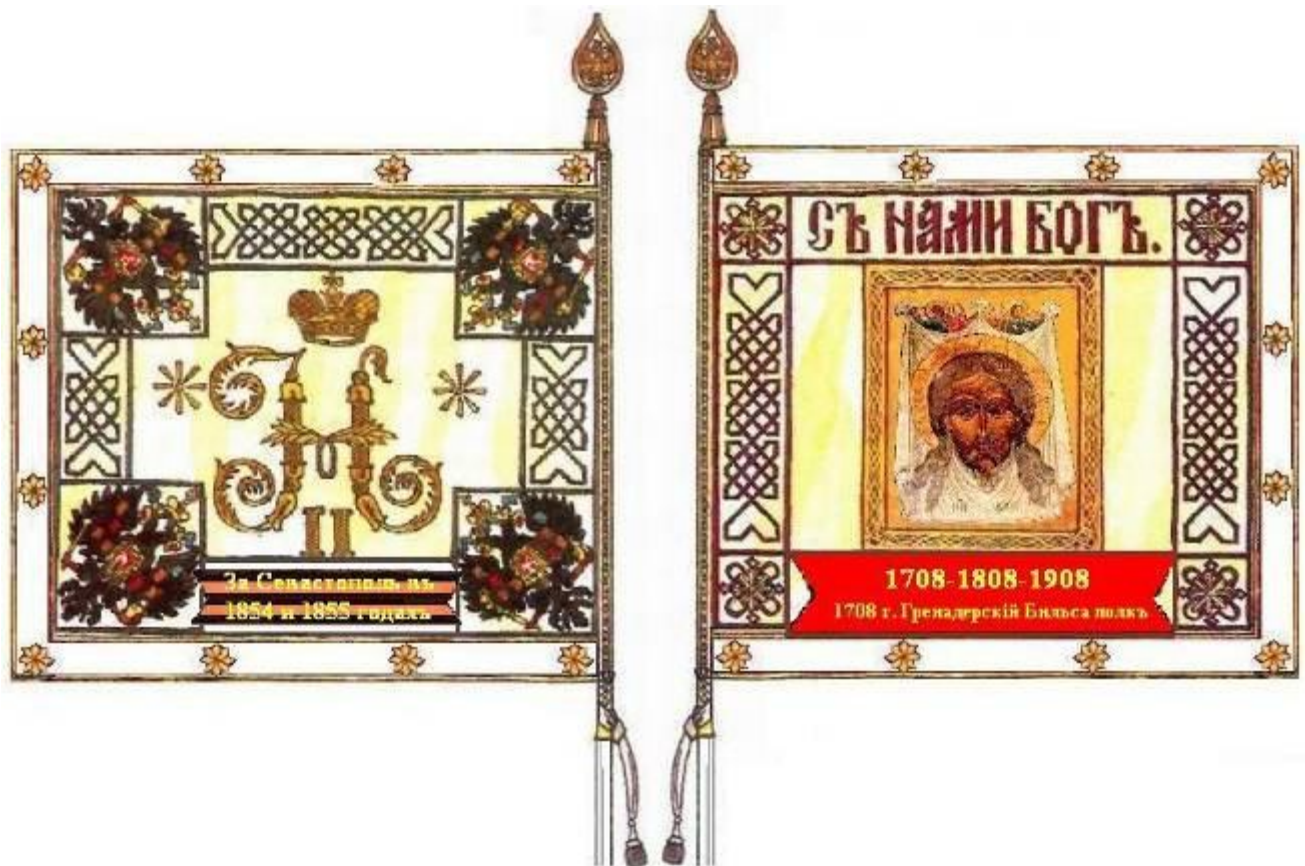
Знамя образца 1894 – 1900 гг. Левая сторона Правая сторона

63-1 пехотный Угличский Генерал-Фельдмаршала Апраксина полк 1908 1.10 Георгиевское юбилейное знамя М1900. Кайма белая. Навершие М1867 (Г. Арм.). Древяно белое. «За Севастополь въ 1854 и 1855 годахъ» (на отр. Георг. ленты) «1708-1808-1908». Спас Нерукотворный. Александровская юбилейная лента «1908 года» «1708 г. Гренадерскій Бильса полкъ». Состояние идеальное. Судьба неизвестна.